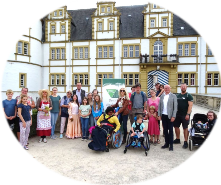
Inklusive Wanderung 03.09.2022