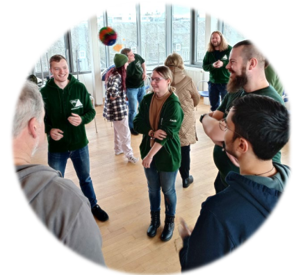
Beiratssitzung in Frankfurt 21. – 22.01.2023