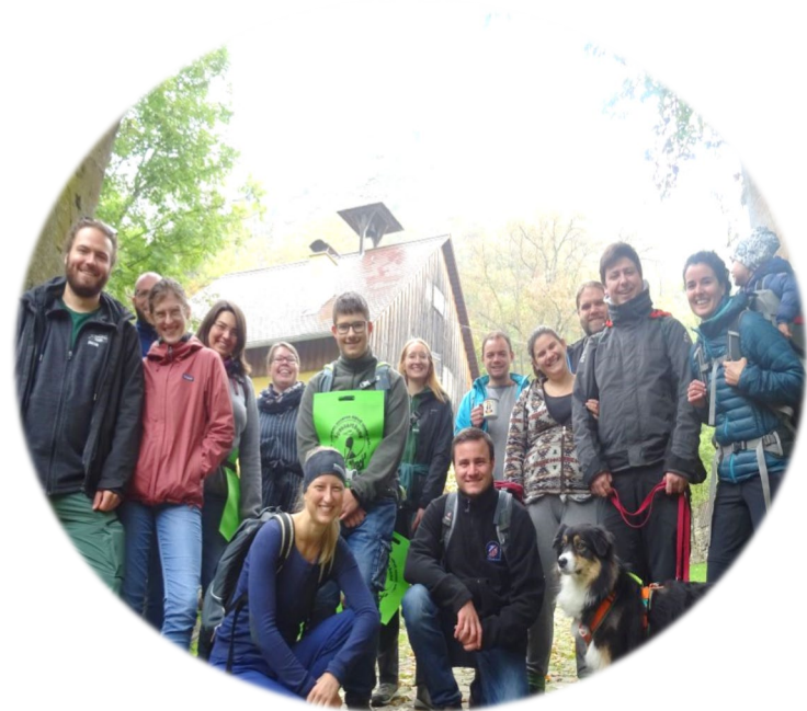
Fahrtenabschlussstreffen 07. - 09.10.2022