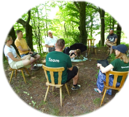
Beiratssitzung in der Rhön 17. – 19.06.