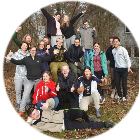
Outdoor-Erste-Hilfe 24. – 26.02.2023