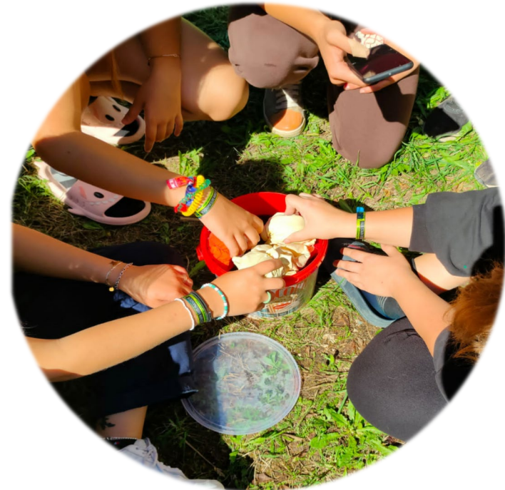
Multilaterale Begegnung auf der Fuchsfarm 28.08. – 04.09.2022