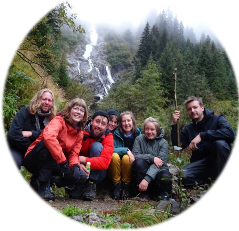
Trekkingtour 04.10. – 13.10.2022