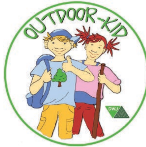
Outdoor-Kids-Seminare 24.09. und 05.11.2022