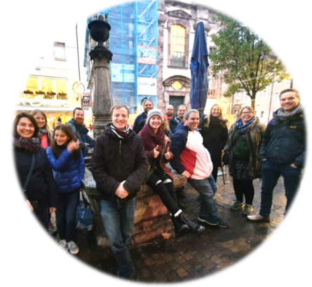
Beiratssitzung in Freiburg 18. – 21.11.2022