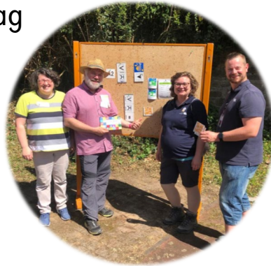
Tag des Wanderns 14.05.2022