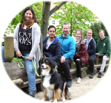
Klausurtagung in Kassel 29.04. – 01.05.