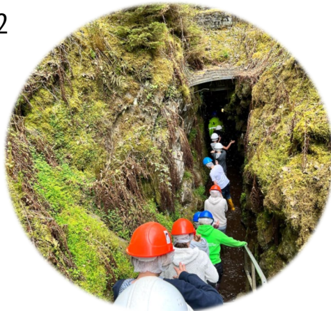
Escape Woods in der Eifel 13. - 15.05.2022