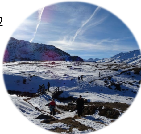
Aktionen im Schnee 02. – 08.01.2023