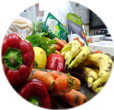
FAIRfressen 3.0 01. - 03.04.2022