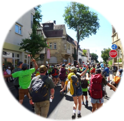
121. Deutscher Wandertag in Fellbach 03. - 07.08.2022