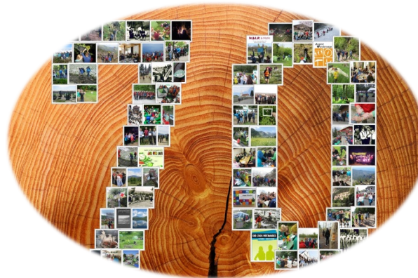
Postkartenaktion 70 Jahre DWJ & Kinderrechte ins Grundgesetz