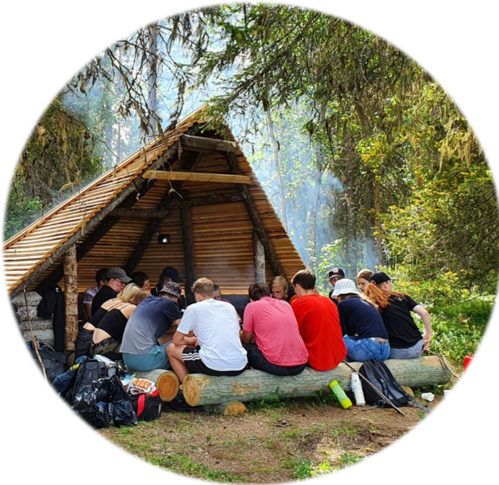
Internationale Jugendbegegnung in Finnland 30. 07. – 07.08.2022